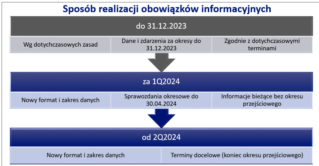
Rysunek 2. Data wdrożenia nowego formatu i zakresu obowiązków informacyjnych