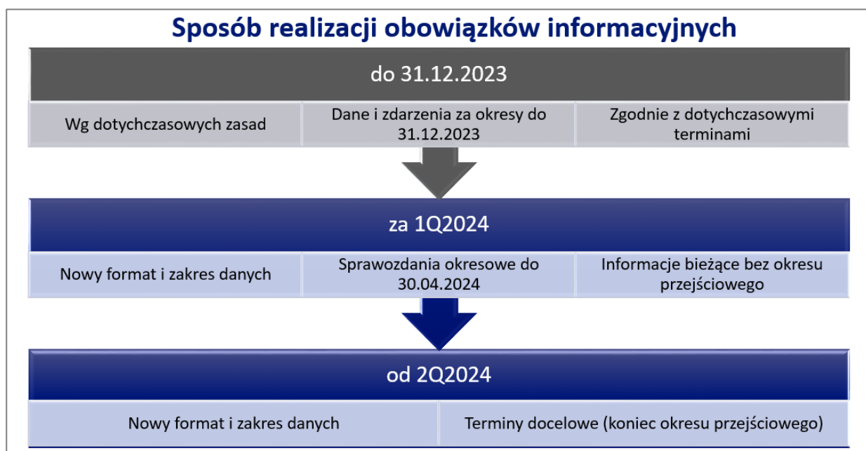
Rysunek 2. Data wdrożenia nowego formatu i zakresu obowiązków informacyjnych

13. § 27. ust 2 rozporządzenia o obowiązkach informacyjnych przewiduje możliwość dostarczenia organowi nadzoru sprawozdań miesięcznych i kwartalnych w docelowym formacie za okresy sprawozdawcze przypadające w pierwszym kwartale 2024 roku w późniejszym terminie niż standardowy tj. do 30 kwietnia 2024 r.